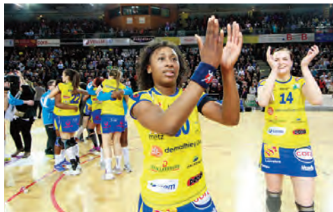
Metz finaliste de la Coupe EHF

L'aventure de Toulon St-Cyr Var HB en Coupe des Coupes s'est arrêtée au 3 e tour face à Leipzig (All). En Coupe EHF, Le Havre finit son parcours européen en 8 e de finale, face à Tertnes Bergen (Nor). De son côté, le HBC Nîmes a atteint les 1/4 de finales de la Challenge Cup, s'inclinant d'un but face à H65 Höör (Suède). Mios Biganos s'incline quant à lui en 1/8 e de finale face à l'équipe polonaise de KSS Kielce.