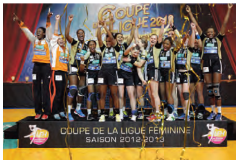
Issy Paris vainqueur de la Coupe de la Ligue

La prochaine édition se déroulera en Lorraine du 20 au 23 février 2014 (demi-finales et finale aux Arènes de Metz).