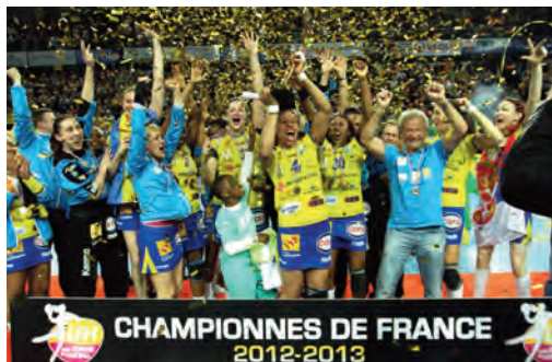
Metz HB Champion de France