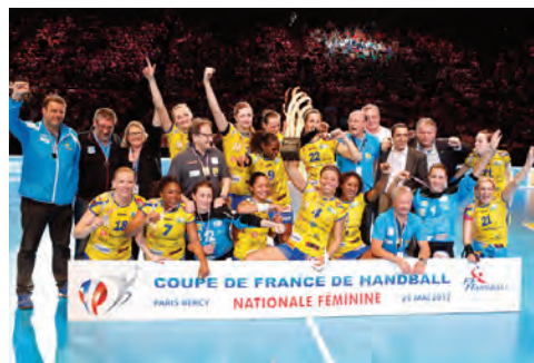
Metz vainqueur de la Coupe de France