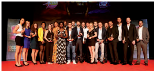
La 3 e Nuit du handball, Folies Bergère, Paris