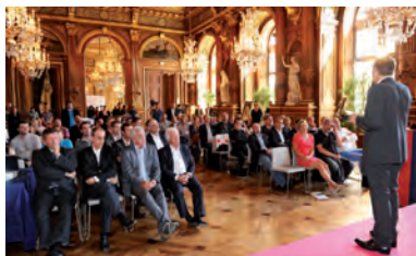
Conférence de presse 2013, Hôtel de Ville de Paris.

Le 3 septembre 2013, les salons de l'Hôtel de Ville de Paris ont accueilli pour la 3 e année consécutive la conférence de presse d'ouverture de la saison. Plus de 100 invités étaient présents. Pour chaque club, l'une des joueuses professionnelles en activité a revêtu la tenue officielle pour une présentation originale et en conditions réelles !