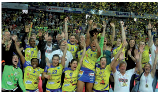
Metz HB Champion de France