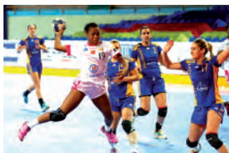
Fleury Loiret / Rostov, tournoi de qualification de la Ligue des Champions

Après sa finale de 2010-11, l' Union Mios Biganos-Bègles réalise un très bon parcours en Challenge Cup où le club est défait par Issy Paris dans le dernier carré de la compétition.