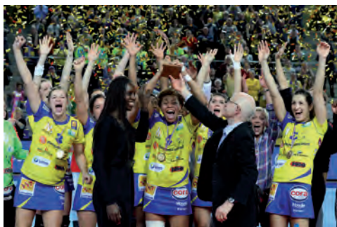
Metz vainqueur de la Coupe de la Ligue

Metz HB a remporté sa 8 e Coupe de la Ligue, qualifiant le club lorrain pour la Coupe d'Europe Challenge Cup 2014-2015. Avec 12 300 spectateurs sur les 3 sites, le record d'affluence de l'évènement a également été battu. La prochaine édition se déroulera du 20 au 23 février 2015, et sera organisée par la Ligue d'Auvergne, territoire sans club féminin professionnel mais particulièrement dynamique et porteur de projets pour développer le handball féminin de haut niveau.