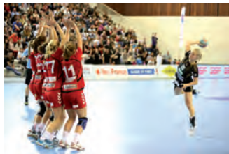
Issy Paris / Höör, finale de la Challenge Cup

Après une défaite en finale de C2 la saison précédente, Issy Paris parvient à se hisser pour la deuxième fois consécutive au dernier tour d'une coupe d'Europe. Malgré une victoire à l'extérieur au match aller (19-21), les Lionnes tombent à domicile face aux Suédoises de Höör (21-23), à la seule différence du nombre de buts marqués à l'extérieur.